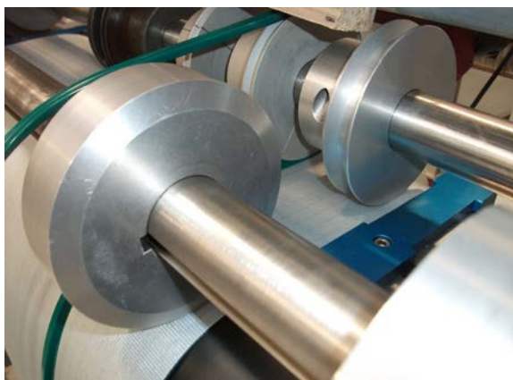
Detalle de la máquina soldando el perfil