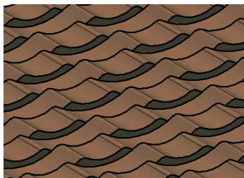
Detalle grabado A